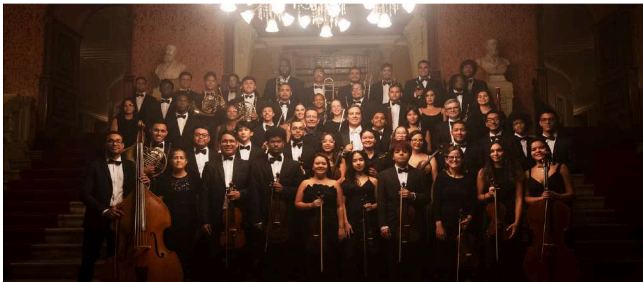
Orchestre des Jeunes Échos d'Amazonie, à Belém sur cette photo.